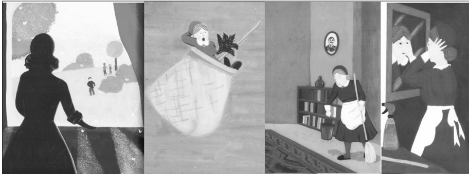
איור 5: מהספר אפשר לעוף גם בלי כנפים.