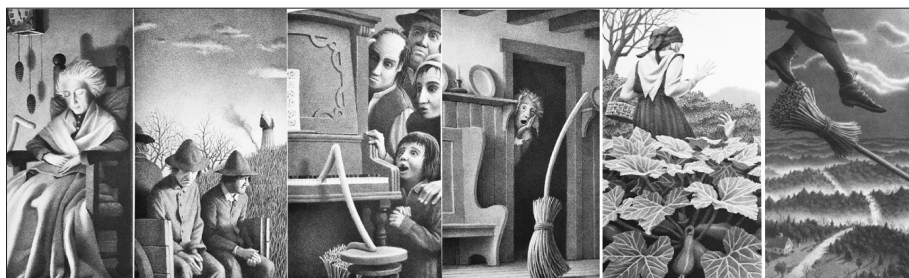
איור 3: מהספר המטאטא של האלמנה.