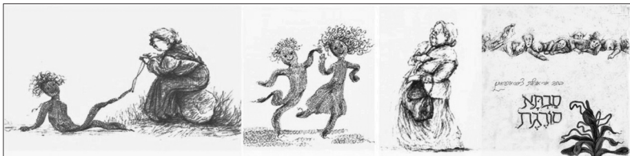
איור 1: מהספר סבתא סורגת .

ספרו של אורי אורלב (1981), שאיירה אורה איתן, סבתא סורגת , מספר על זקנה בודדה המגיעה לעיר קטנה ולא מוצאת בה דירה. היא סורגת לעצמה דירה ואת כל תכולתה ונכדים ועושה מאמצים שיקבלו את נכדיה הסרוגים. כשהדבר לא עולה בידה בהצלחה היא פורמת את כל מה שסרגה. שמה של הזקנה שנקראת בסיפור סבתא סורגת אינו ידוע, אלא הוא מושאל כשם פעולה מהסריגה. מבחינת מראה, הזקנה עונה לסימבוליקה הוויזואלית המקובלת של זקנה חביבה, מלאת גוף, בשמלה ארוכה ותפוחה המטשטשת את מותניה, צעיף מונח על כתפיה ותיק בזרועותיה. שערותיה הלבנות אסופות לקודקודה והיא מרכיבה משקפי ראייה. אפשר שהמראה של זקנה חביבה מבקש להטעות את הקוראים באשר לכוונותיה וליכולותיה.