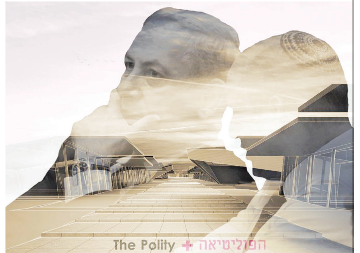
נוה סידו - ארכיטקטורה