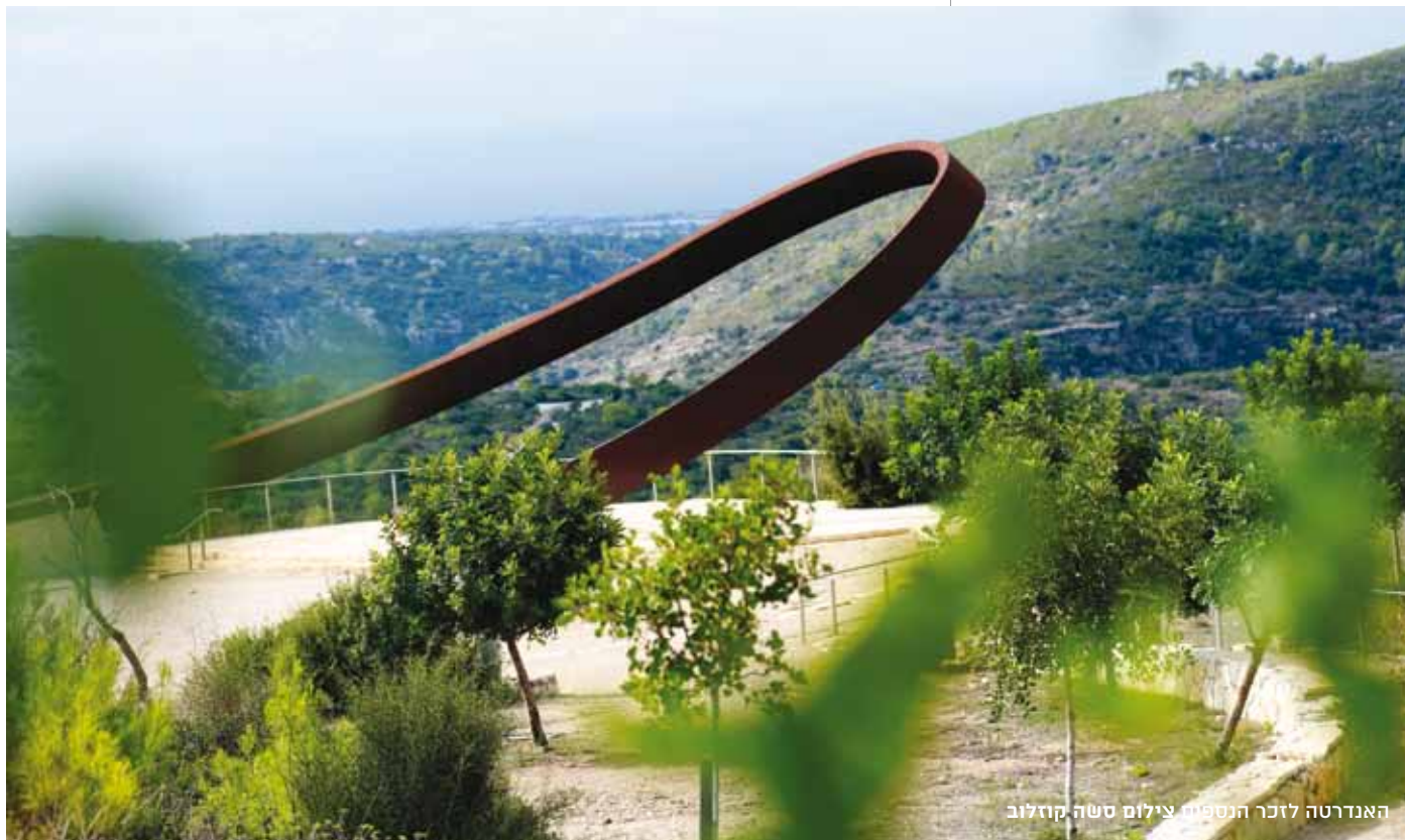
האנדרטה לזכר הנספים

2 בדצמבר 2010 היה יום שחור, והוא ייזכר בלב רבים מאיתנו עוד שנים רבות. היה זה נר ראשון של חנוכה. גשמי החורף בוששו להגיע, הקרקע הייתה יבשה עדיין וכך גם העשבים עליה. עמוד עשן אפור-שחור סמך ורחב היתמר גבוה מעל להר הכרמל ונראה ממרחק של יותר ממאה קילומטר. זו הייתה תחילתה של שרפת היער הגדולה ביותר שתועדה בארץ. במשך חמישה ימים נשרף לב הכרמל; כ-25 אלף דונם של שטח טבעי, של בתים ושל רכוש עלו באש, ונגבו אבדות כבדות בנפש.