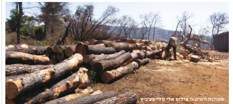
פעולות השיקום