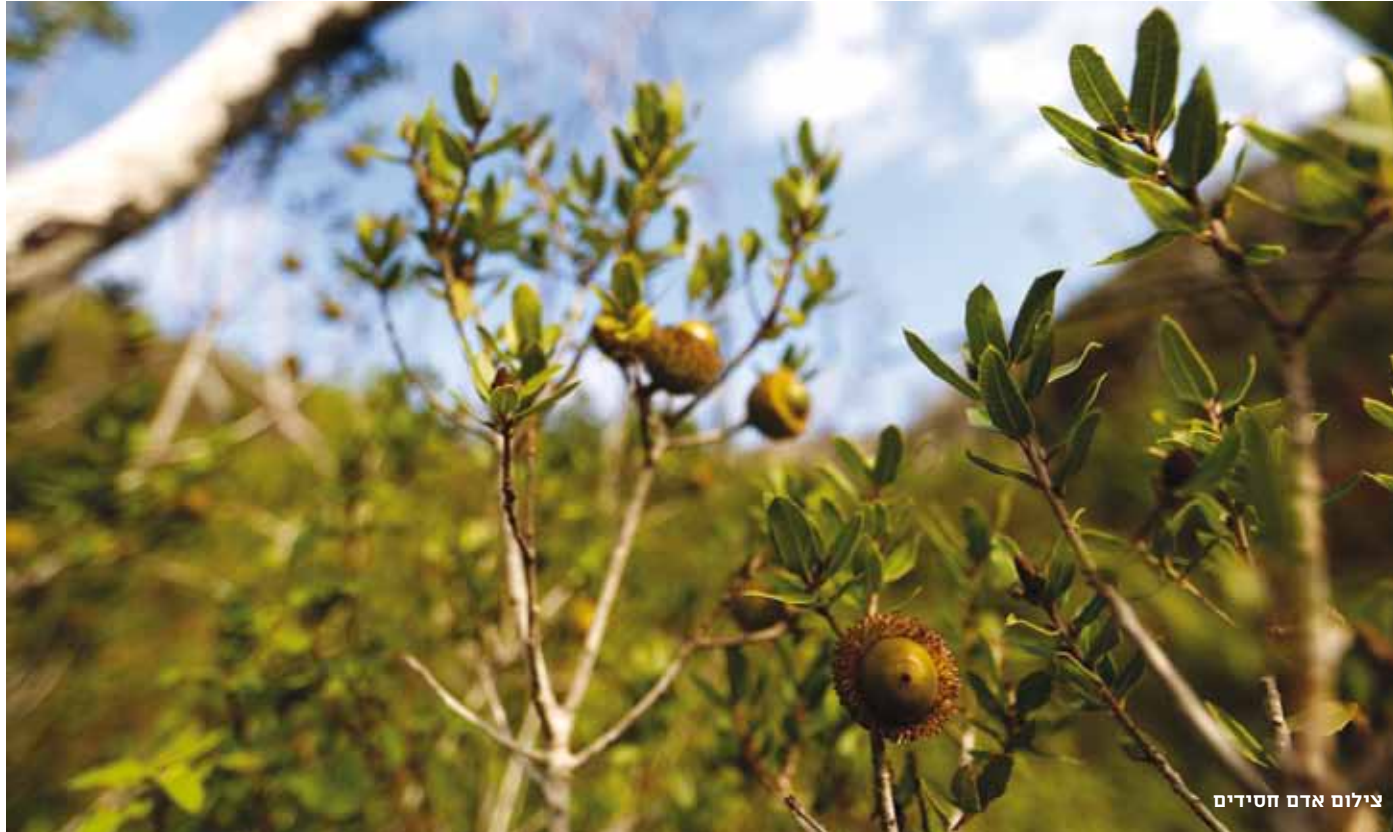
צילום אדם חסידיים