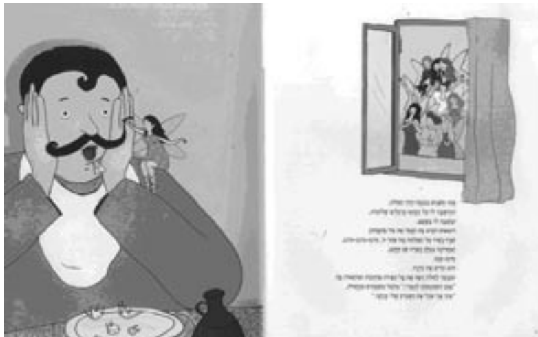
איורים: טלי מנשק, מתוך ספרה של יהודית קציר 'לשחרר את הפיות'